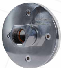
GMTRB-FX1-34 SISTEMA DI FISSAGGIO per tutte le versioni delle sonde triboelettriche. Idonea per permettere l'installazione in zona ATEX : Categoria 2D/2G