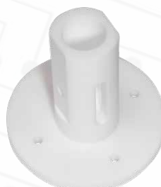
GMTRB-FX2-IS SUPPORTO ISOLATO IN "POM-C" Si consiglia l'uso per steli di lunghezza maggiore di 850mm. Temperatura massima di utilizzo in continuo per 5000 ore +110°C