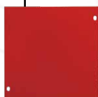
TAPPO IN LAMIERA (incluso) GMTC4