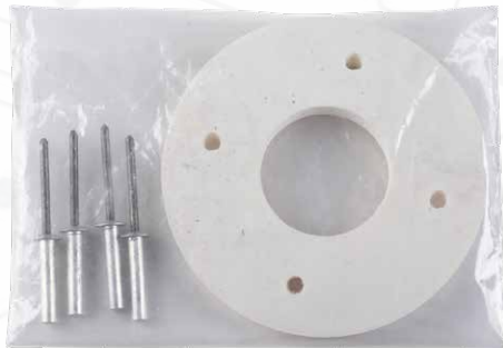
Guarnizione con 4 rivetti stagni 4,8x25 mm Gasket with 4 airtight rivets 4,8x25 mm