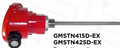
GMSTN415D-EX GMSTN425D-EX Trasduttore di temperatura