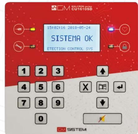
Pannello unità di controllo