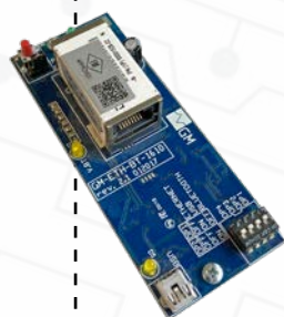
SCHEDA ETHERNET USB (optional) GM-ETH-BT-1610-FM