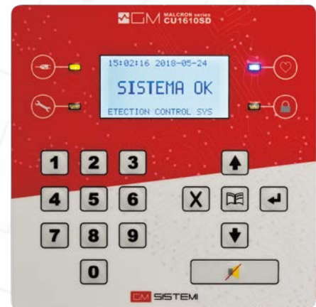
Pannello unità di controllo