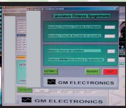
Software per il corretto dimensionamento impianti