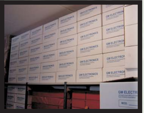
Magazzino prodotto finito